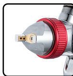
Agulha e bico de aço inox. Aceita ampla variedade de fluidos sem oxidar