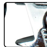
Corpo de alumínio e acabamento cromado. Equipamento mais leve e design ergonômico