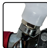
Alimentação por gravidade. Caneco de 600ml com coador interno e gancho móvel de metal