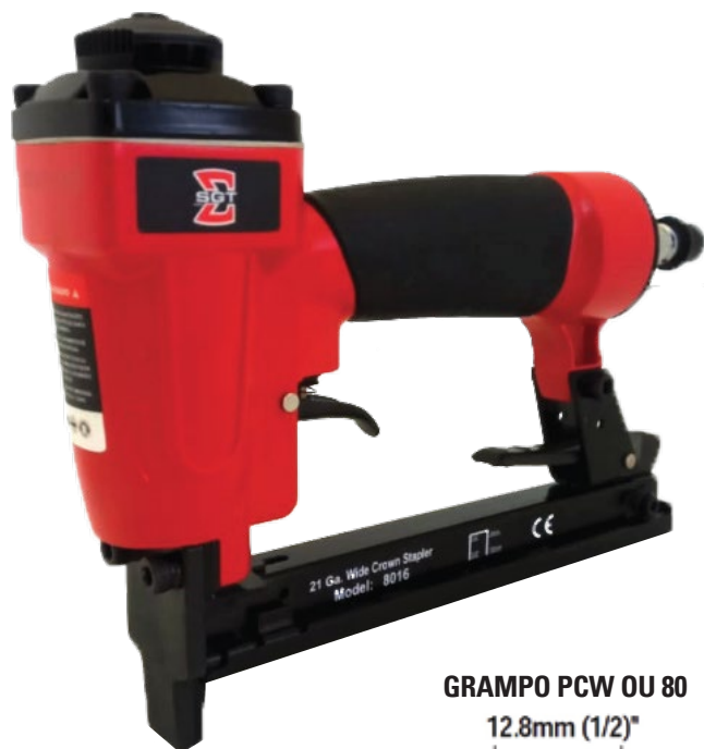
GRAMPO PCW OU 80