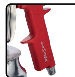
Corpo e caneca de alumínio. Equipamento mais leve e design ergonômico