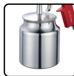
Alimentação por sucção. Caneca de 1000ml