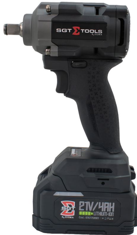
MALETA COM 2 BATERIAS E 1 CARREGADOR