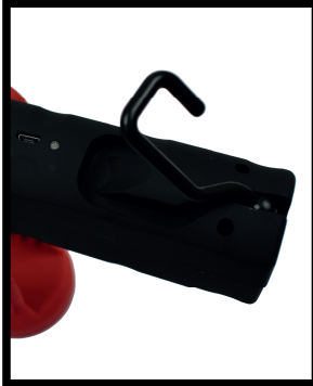
Gancho de Fixação