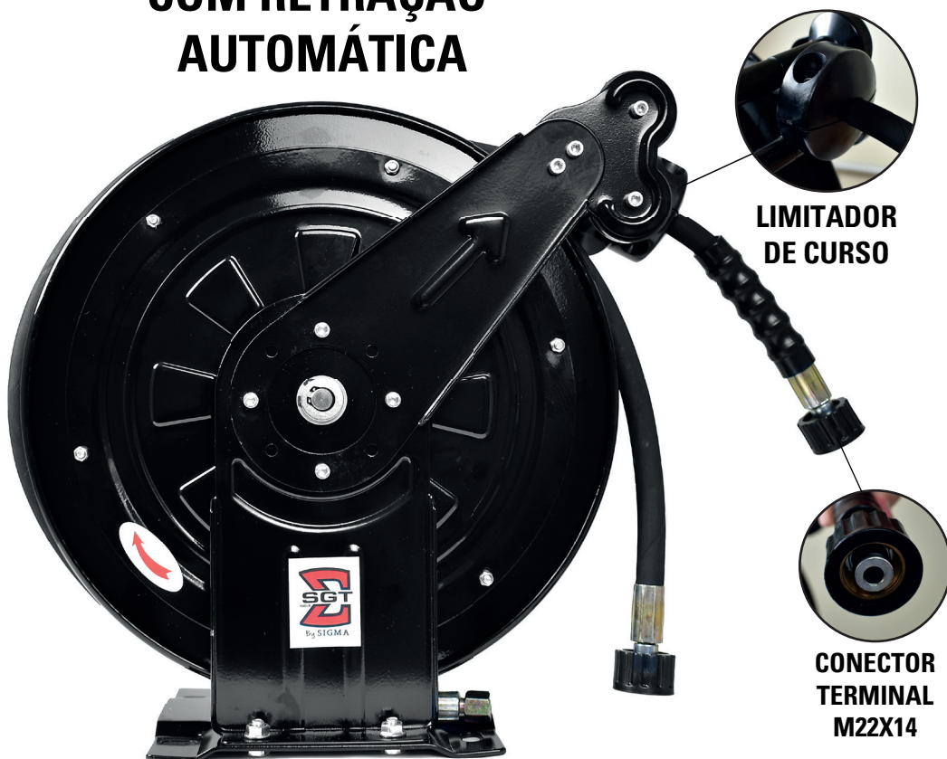
LIMITADOR DE CURSO